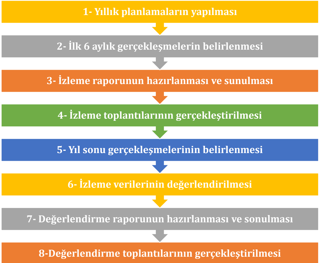
Şekil 2 İzleme ve Değerlendirme Süreci

Yıllık planın uygulanmasında yürütme ekipleri ve eylem sorumlularıyla aylık ilerleme toplantıları yapılacaktır. Toplantıda bir önceki ayda yapılanlar ve bir sonraki ayda yapılacaklar görüşülüp karara bağlanacaktır.